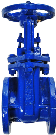
Fig. 013 / 31 PN 16