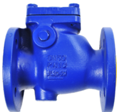
Fig. 411/619 PN16