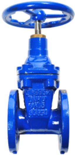
Fig. 027 / 58 PN16 ACS