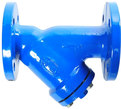
Fig. 306/539 PN16