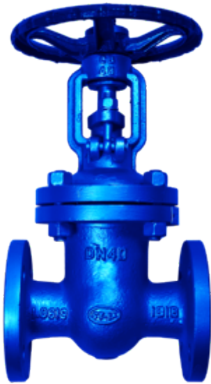
Fig. 033 / 78 PN40 ACS